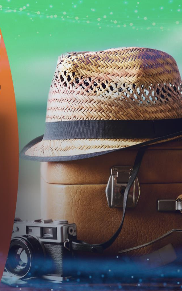
SERVIÇOS DE TURISMO