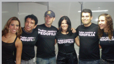
Tempero do Mundo