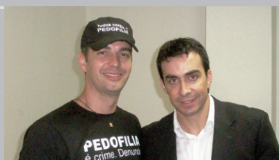
Padre Fábio de Melo