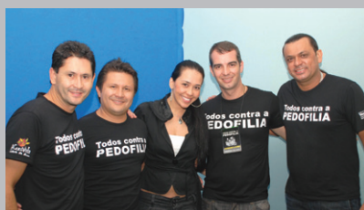
Gian & Giovani e Frank Aguiar